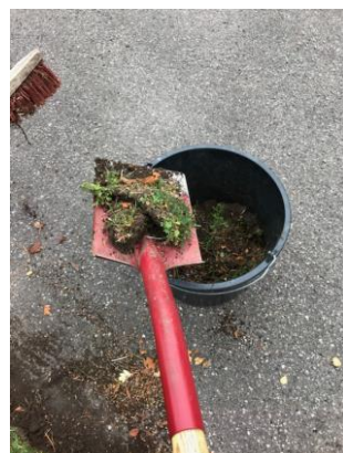
6. Det er nemt at feje og fjerne afskæringen i en spand eller trillebør.