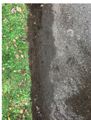
9. Sådan ser den færdige kant ud.