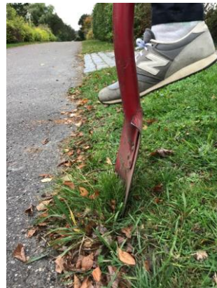
2. Sæt spaden lodret ned, træng godt ned og vip spaden ud.