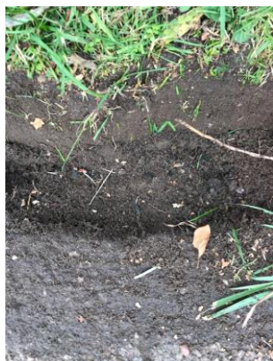
7. Her ser man renden mellem græskanten og asfaltkanten.