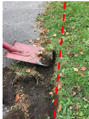
4. Det kan betale sig løsne udefra da græsset kan vokse ud over asfaltkanten