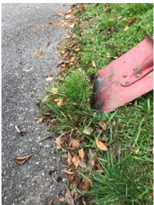
3. Fortsæt med at stikke ned langs hele vejkanten.