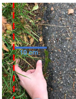
10. Og sådan ser kanten ud efter lidt tid. Der er mere græs men stadig 10 cm, hvor vandet kan løbe fra ☺