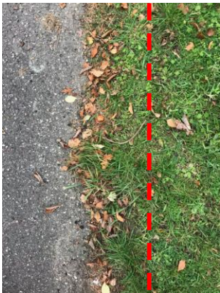
1. Start med at grave ca. 10 cm fra der, hvor du formoder asfalten ender.

Når græsset beskæres, dannes en rende, hvor vandet kan løbe af vejen og trænge ned i jorden. Hermed beskyttes vejen.